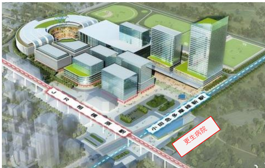
相模原市発表の将来構想図